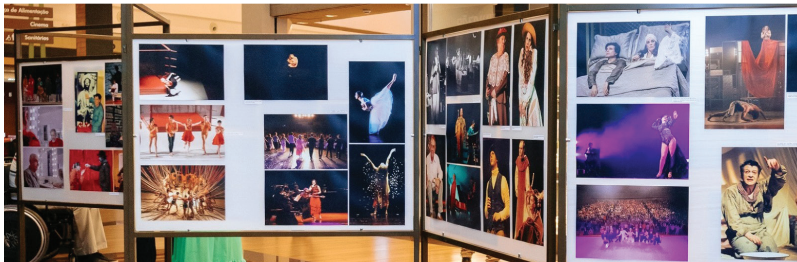
Trabalho traz recortes de espetáculos trazidos para a cidade através de produções culturais