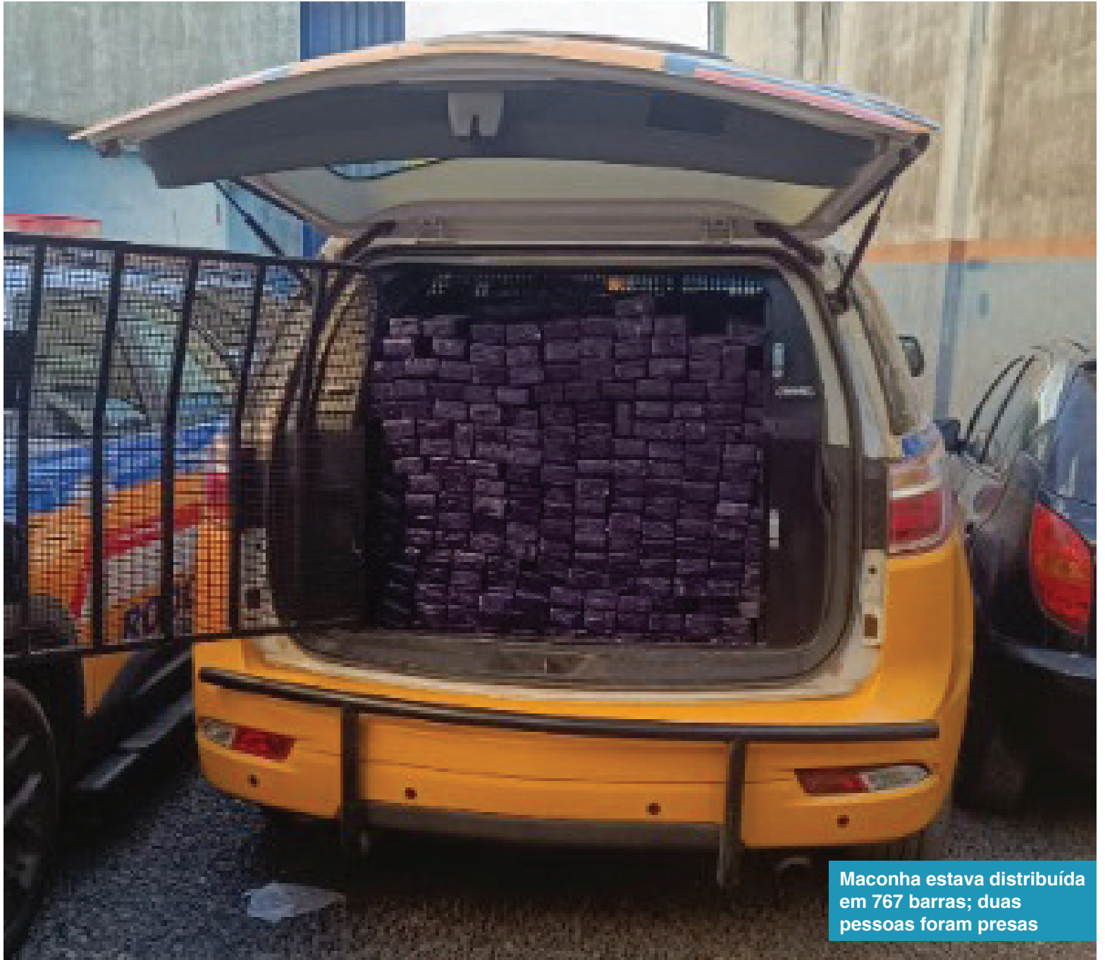
Maconha estava distribuída em 767 barras; duas pessoas foram presas