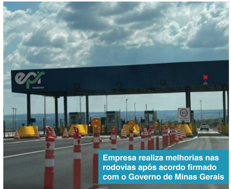
Empresa realiza melhorias nas rodovias após acordo firmado com o Governo de Minas Gerais

Após a reunião, foi firmado um acordo em que a EPR Triângulo terá até o dia 31 de maio para cumprir uma série de etapas previstas para execução. Dentro do cronograma,